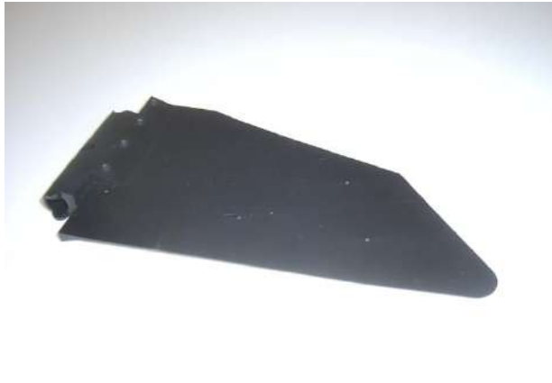
人工鳥翼射出成形品