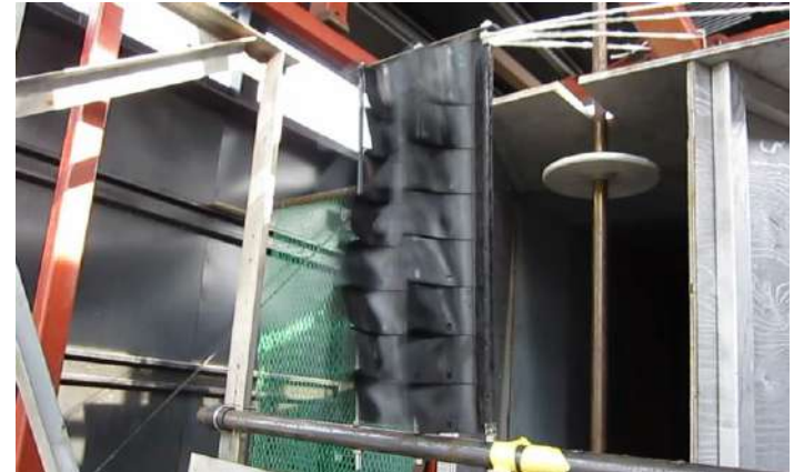
高分子材人工鳥翼風洞での耐久試験 風速50m/s 3時間