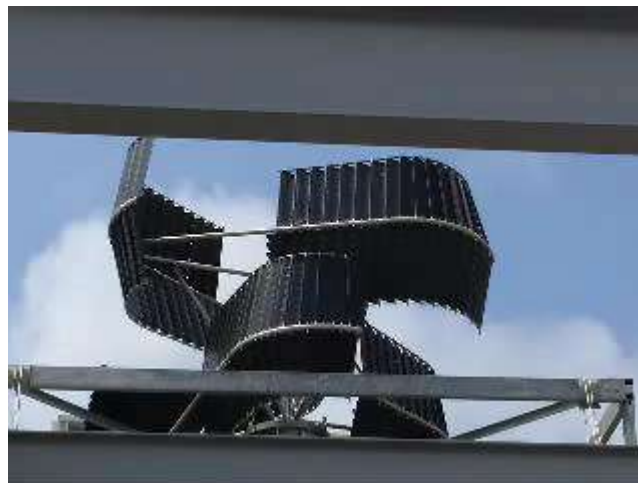
沖縄ビル屋上設置v