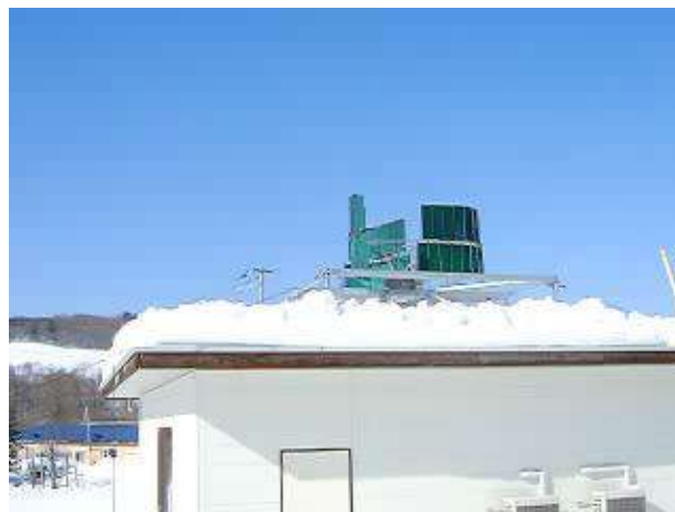
北海道陸別町でのフィールド試験v 日本で最も寒冷な気候 積雪75cm 気温マイナス30度v