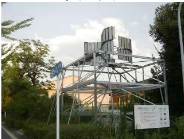
天理設置v 3段鉄骨地上5m